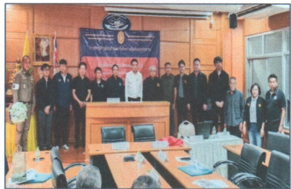
หัวหน้าส่วนราชการถ่ายรูปร่วมกับประธาน