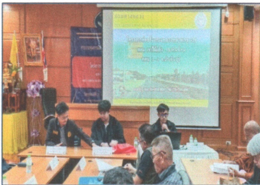
วิทยากรจากสำนักสำรวจและออกแบบ กรมทางหลวง